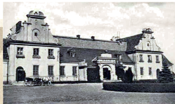
2 września 1939 r. na bocznicę stacji Koło rozegrała się tragedia pasażerów...