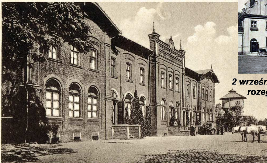
KROTOSZYN. Dworzec. 01.09.1939 r. zostaje sformowany pociąg ewakuacyjny, który wyrusza na północ...