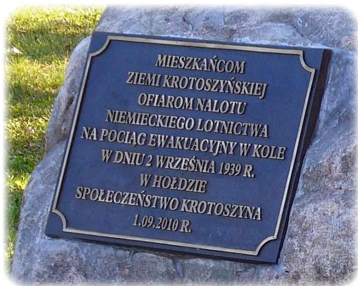
Tablice pamiątkowe poświęcone ofiarom nalotu